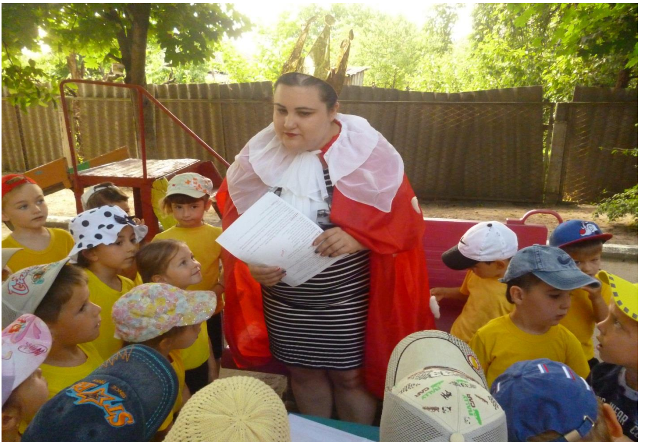
Станция «Сказочная». Загадки, пазлы, сказки.