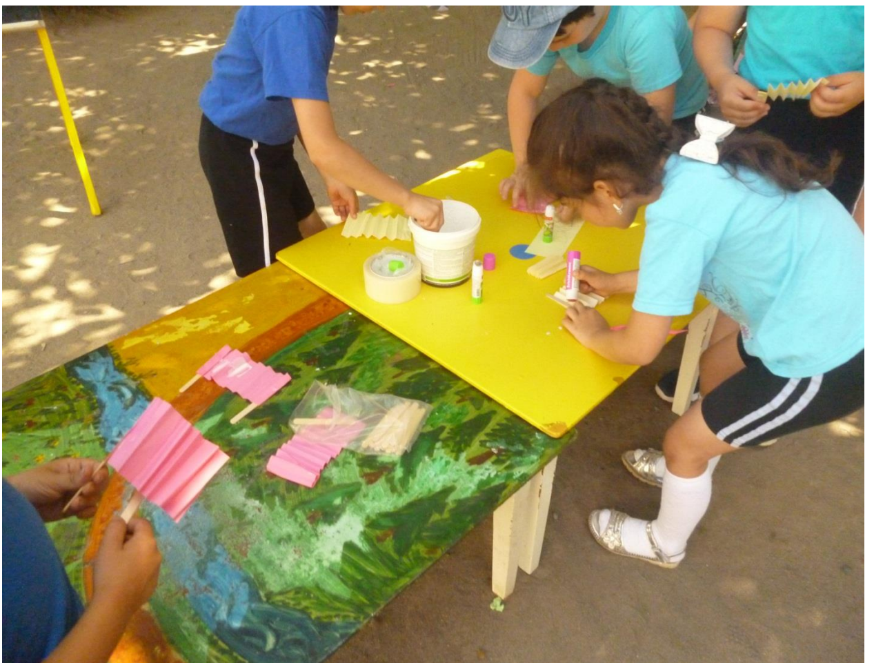
Станция творческая «Самоделкин»