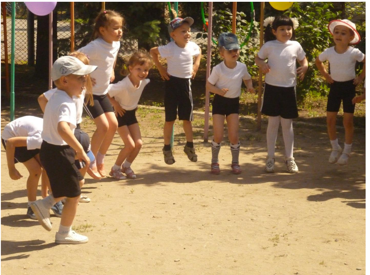
Станция спортивная «Крепыши»