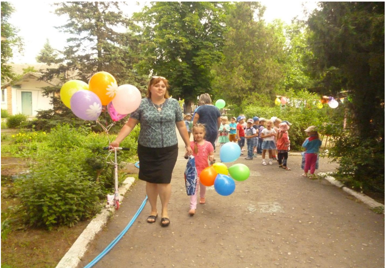
Дети идут в детский сад с шарами