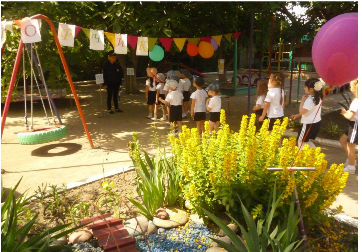
Станция дорожного движения «Светофорчик»