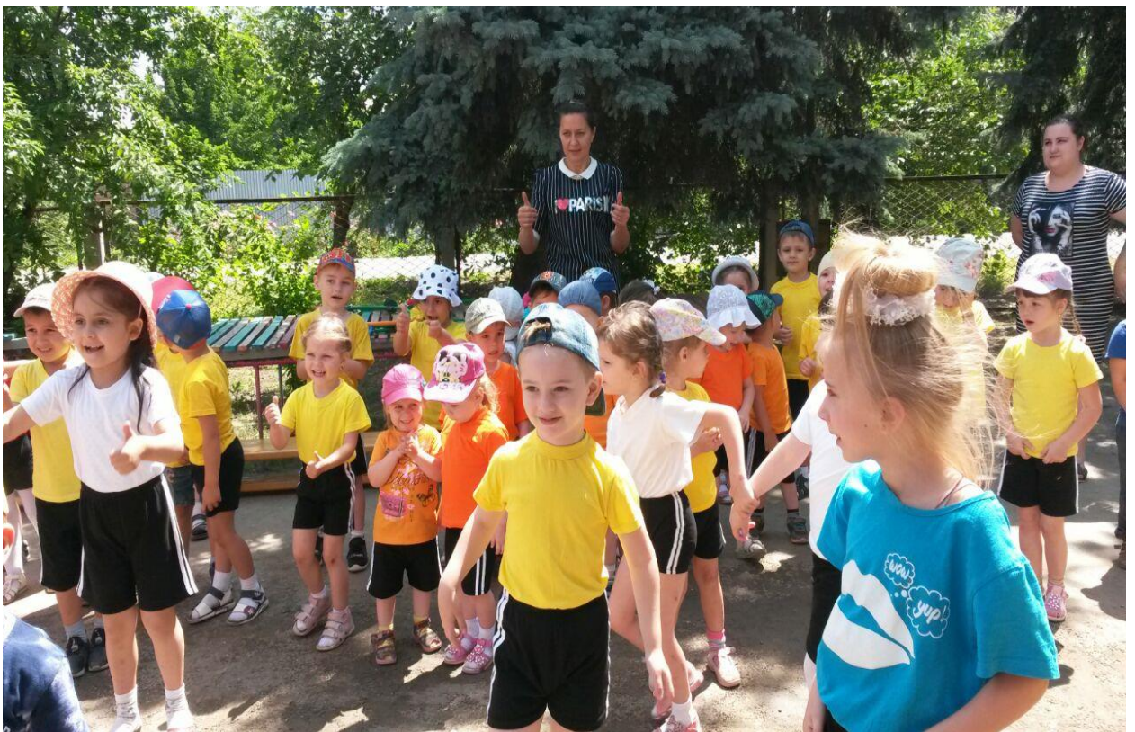
Спортивная площадка. Музыкальная игра «Как живешь?», и флешмоб «Фиксики»