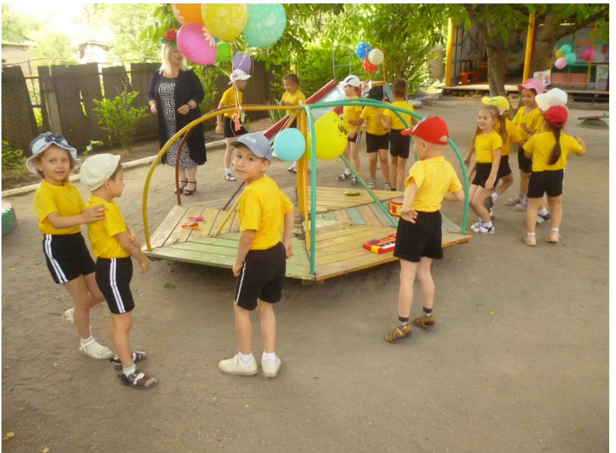
Станция музыкальная «Барбарики».