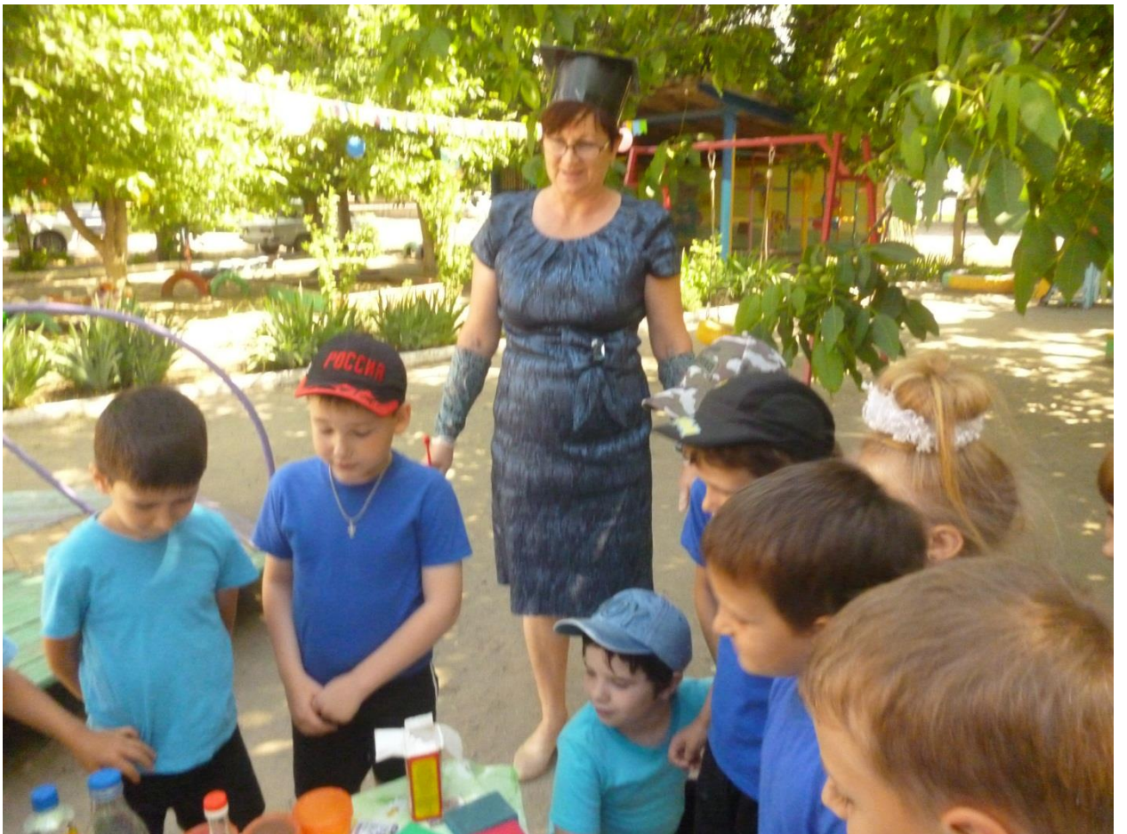
Станция экспериментальная «Юные ученые»