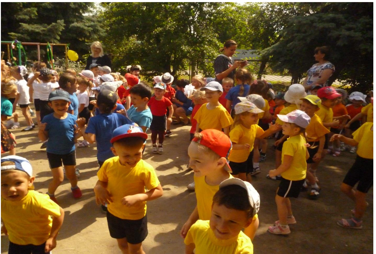
Спортивная площадка: стихи, песня «Дружба», музыкальная игра «Приветтики». Дети отправляются в «Волшебный мир детства».